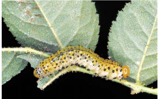
Foto 6 - Larva di argide.