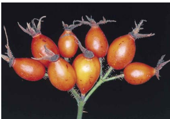
Foto 3 - I frutti.