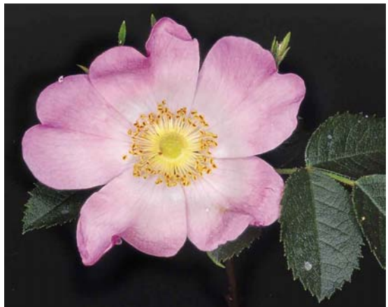
Foto 2 - Particolare del fiore.

14-18 denti composti e ghiandolosi. Piccolo e rachide rivestiti di ghiandole; stipole con margini paralleli ed apici divergenti, fornite di piccole ghiandole (Foto 1).