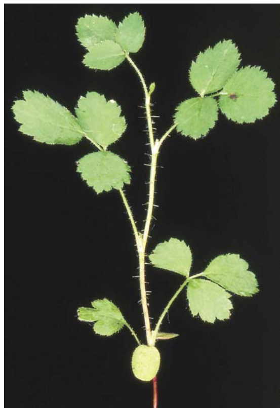
Foto 7 - Un semenzale in giovanissima età.