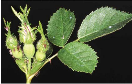
Foto 5 - Gli afidi sui boccioli.