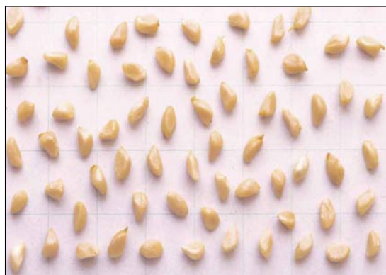
Foto 4 - Semi su carta con quadretti di 10x10 mm.